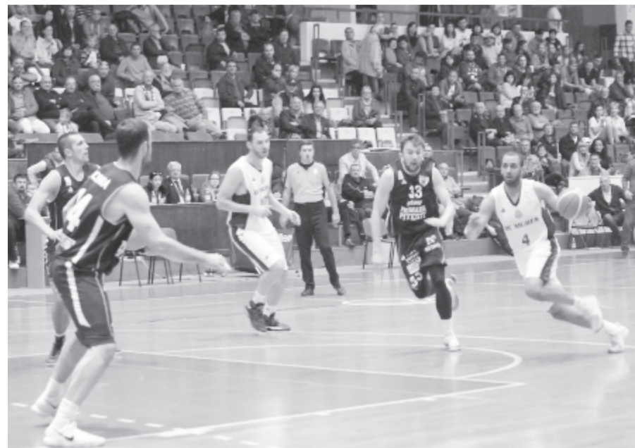
A Pitești elleni mérkőzéshez hasonlóan ismét nagyon jó statisztikát produkált Person (j), bár „csupán” 13 pontot szerzett, de ha elvállalta, dobásai többnyire pontosak voltak, és kiosztott hét gólpasszt, levett három lepattanót.

Ha a statisztikákat nézzük, az adatok kiegyenlítettek, még a dobószázalékok is, talán Galac dobott pontosabban palánk alól, de távolról mindkét fél 40% fölött teljesített. A különbséget végül az adta, hogy a Phoenixnek több kísérlete volt összességében, így azonos pontossággal is több pontot szerzett. Ez a több dobás nem származhatott lepattanókból, mert itt egyenlő (26-26) az állás, így az eladott labdák nagy száma biztosított több lehetőséget a házigazdáknak. Ha a Pitești elleni meccsen alig hat támadást zárt dobás nélkül a Maros KK, ezúttal 16 ilyen eset volt, ami egy felnőtt férficsapat esetében nagy számnak számít. Ebből 5 kötődik Mitchellhez, ami azt is mutatja, hogy az amerikai a pontjaihoz sokat kockáztatott is.