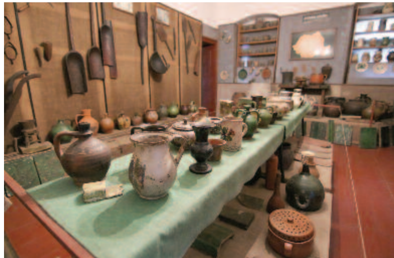
A makfalvi néprajzi múzeum

Makfalván 2007-től repülőtér van, ahol sétarepüléseket ajánlanak a turistáknak.