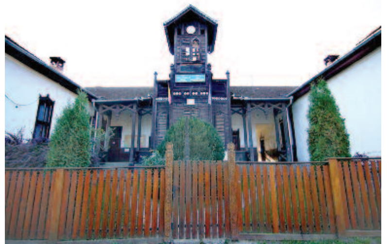
A sóváradai régi iskola

Neve először az 1332-es pápai tizedjegyzékben szerepel Varad néven. Az 1567-es regestrumban Sóváragya néven, 22 kapuval jegyezték a falut, az 1635-ös lust-rában a Sóváradgia névalakot találjuk.