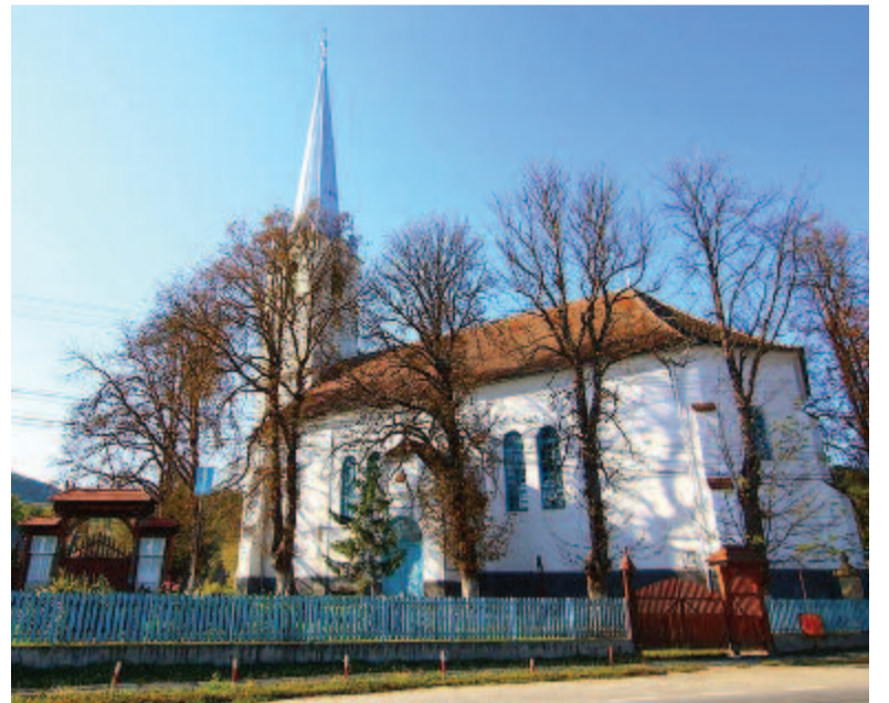
A makfalvi református templom

korabeli érmet találtak, amiből pontosan meghatározhatták, hogy Vespasianus császár idején, az i. sz. I. században teljesítettek szolgálatot védői, valószínűleg a rómaiak daciai visszavonulásáig. Sajnos, kevés